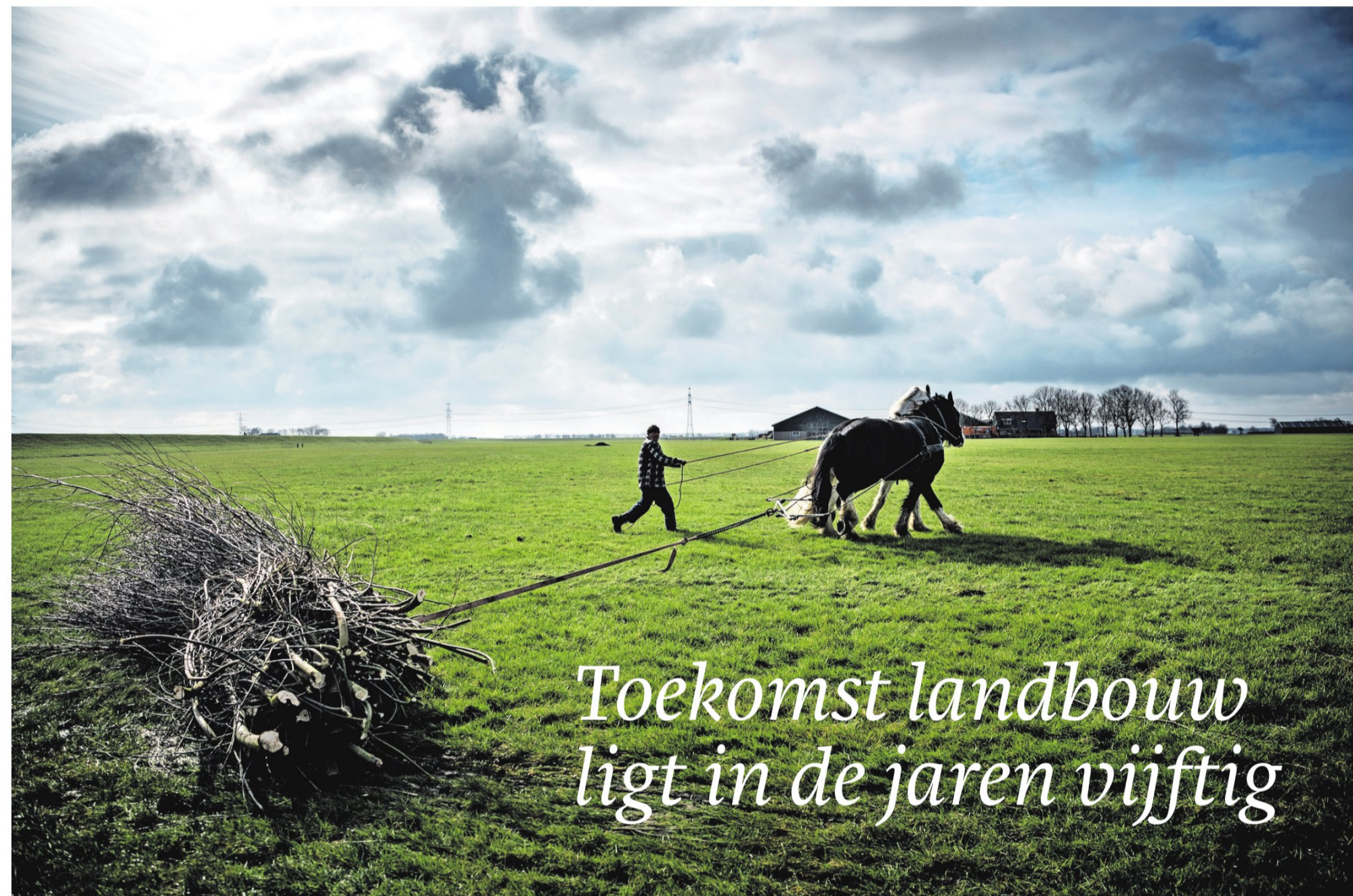
Twee trekpaarden aan het werk in Garnwerd.

tekst Emiel Hakkenes illustratie Bart Friso